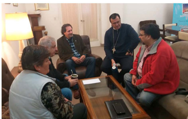
Reunión con el Monseñor Gabriel Mestre en el Obispado de Mar del Plata

Autor de los poemarios "Búsqueda", "Clima de poeta", "Vínculo", "Crossover. Apuntes e improvisaciones" y "Círculos de dorje", y del libreto de la obra teatral "Un grito de corazón: ¡viva el pueblo!".