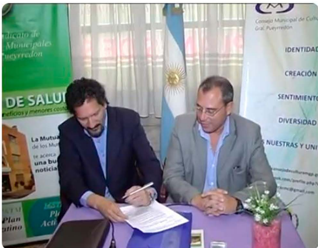
FIRMA CONVENIO MSTM y CMC.mpg