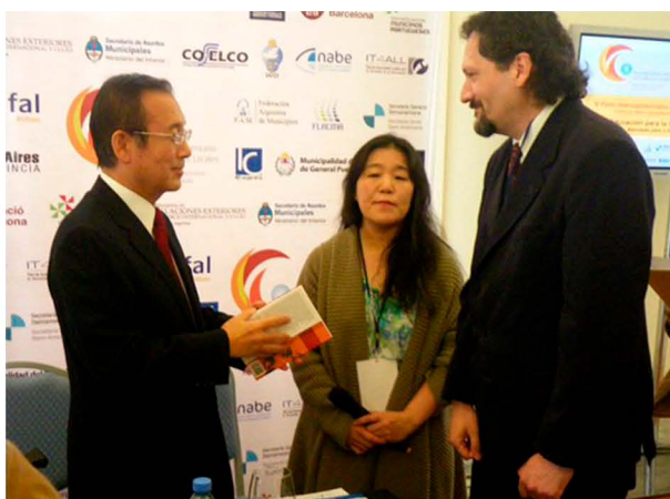
Encuentro con el Alcalde de Hiroshima, Tadatoshi Akiba, Presidente de la Liga Alcaldes por la Paz