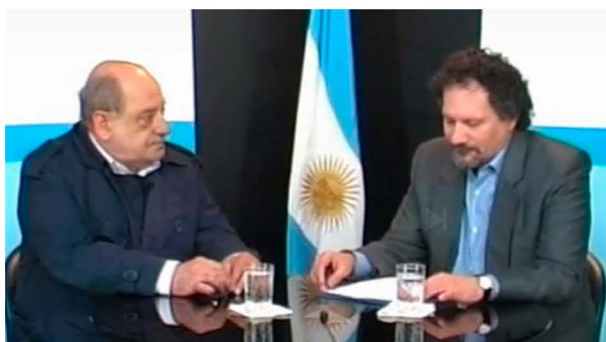
Entrevista con el Intendente Carlos Arroyo