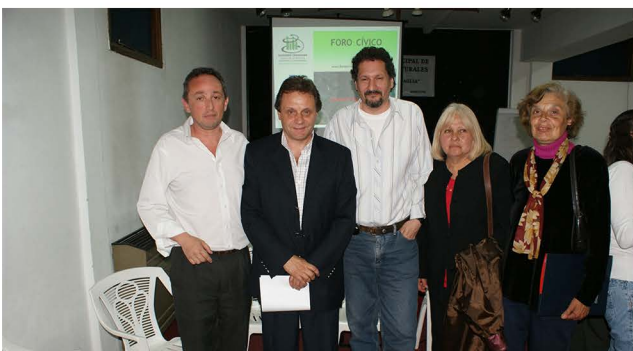
Reunión del Foro Cívico con Intendente Gustavo Pulti