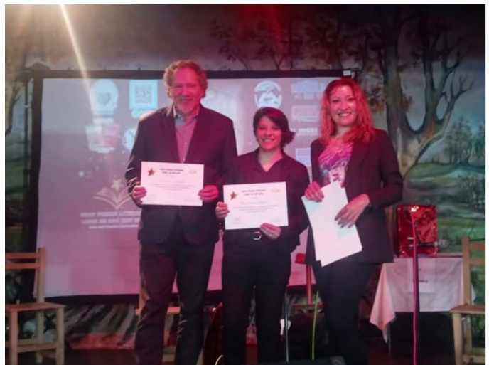
Personalidad destacada de la Cultura Mar del Plata 2023