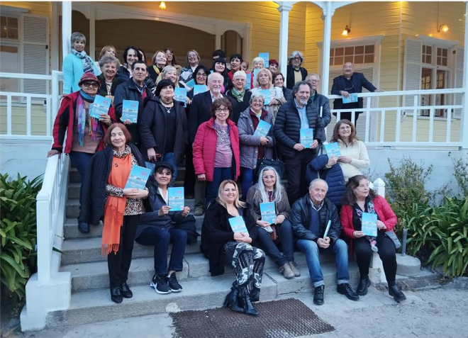
Presentación de Antología SADE 2023 en Villa Victoria