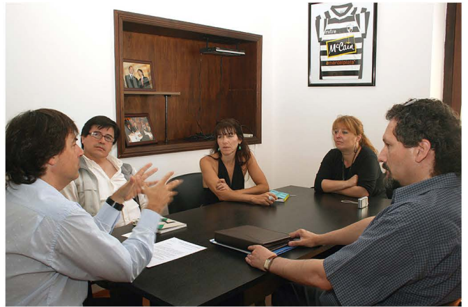
Convenio entre CMC y EMTUR